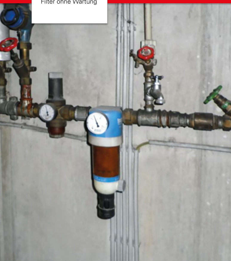
Filter ohne Wartung