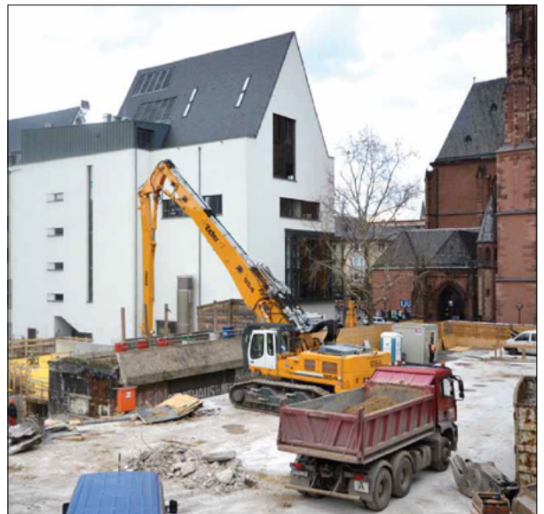
Baustelle am Archäologischen Garten