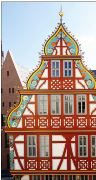
Renaissancefassade der Goldenen Waage