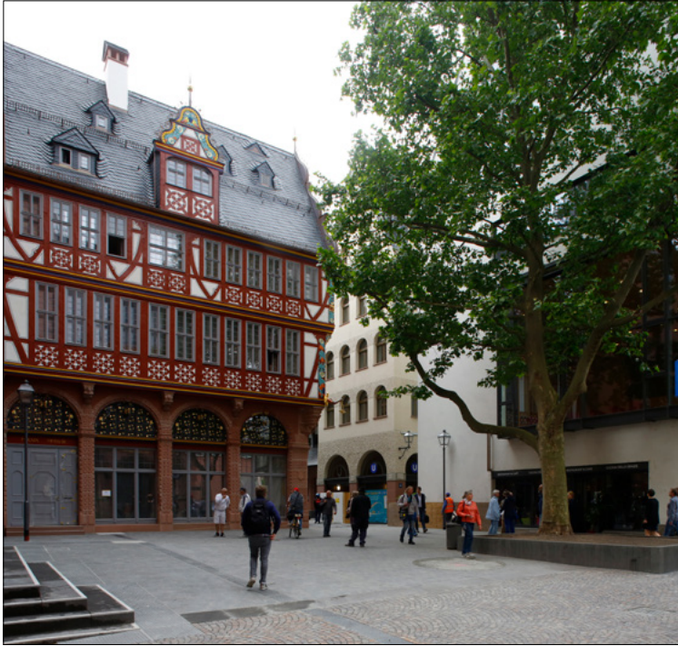
Stadthaus mit Vorplatz zum Dom