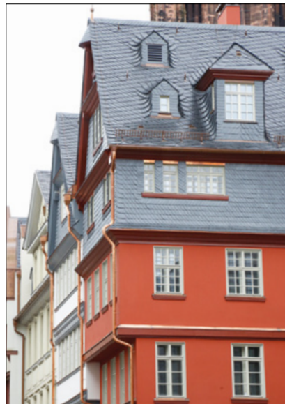
Markt 17 (Rotes Haus)